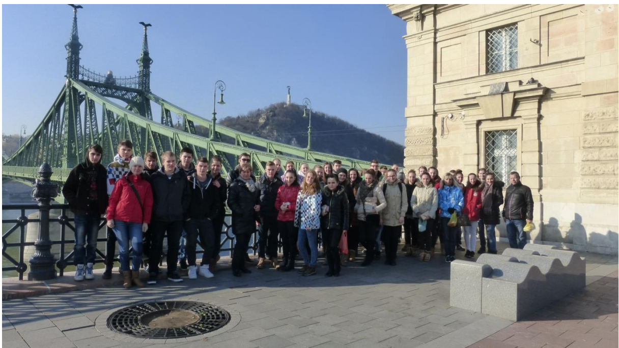
Most, ktorý postavil Alfred Eiffel