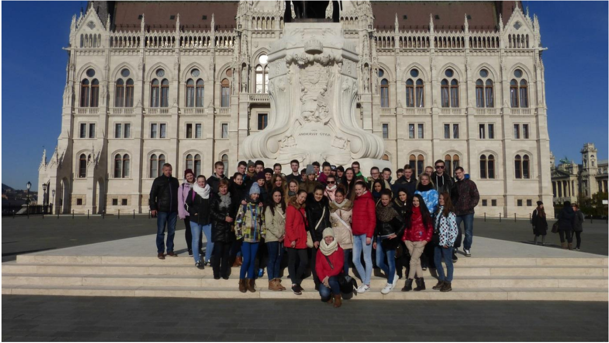
Parlament so sochou Andrassyho