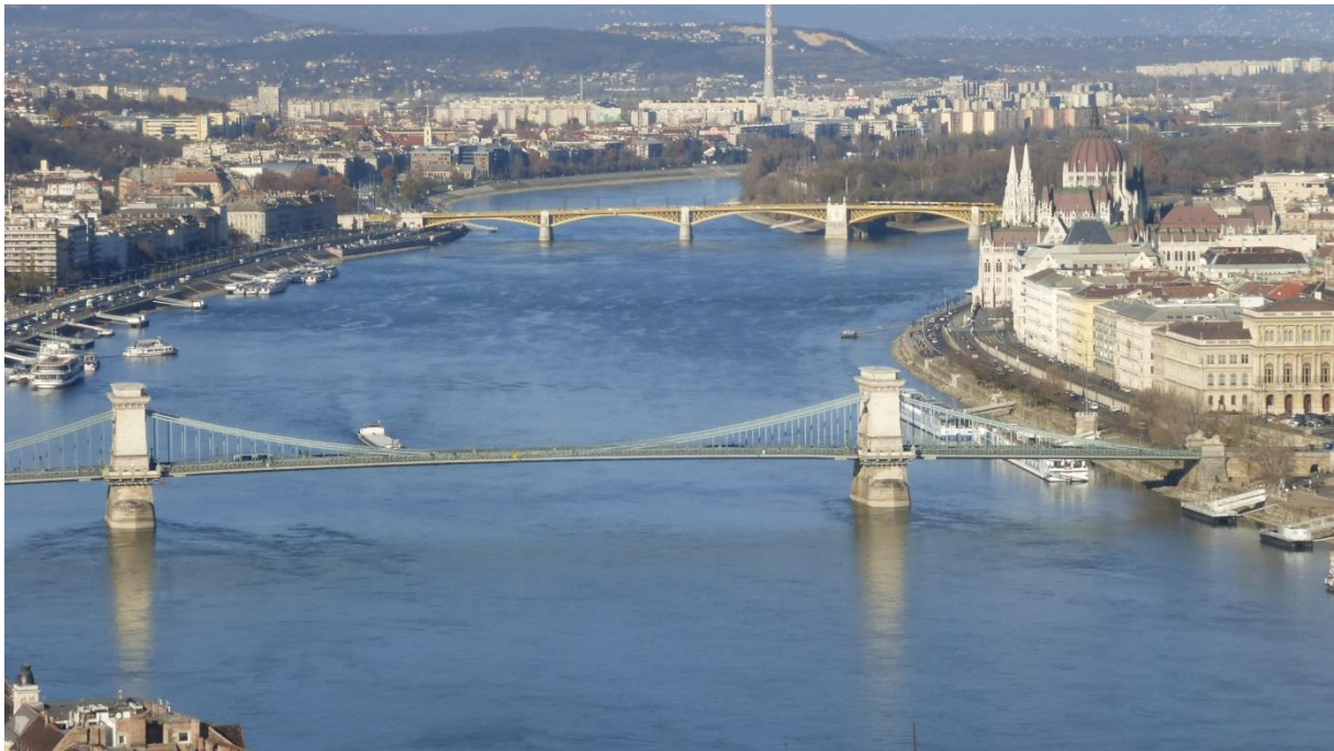
Pohľad na mosty na Dunaji