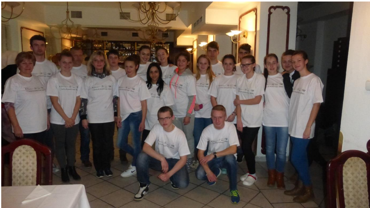
Účastníci exkurzie v ubytovacom zariadení