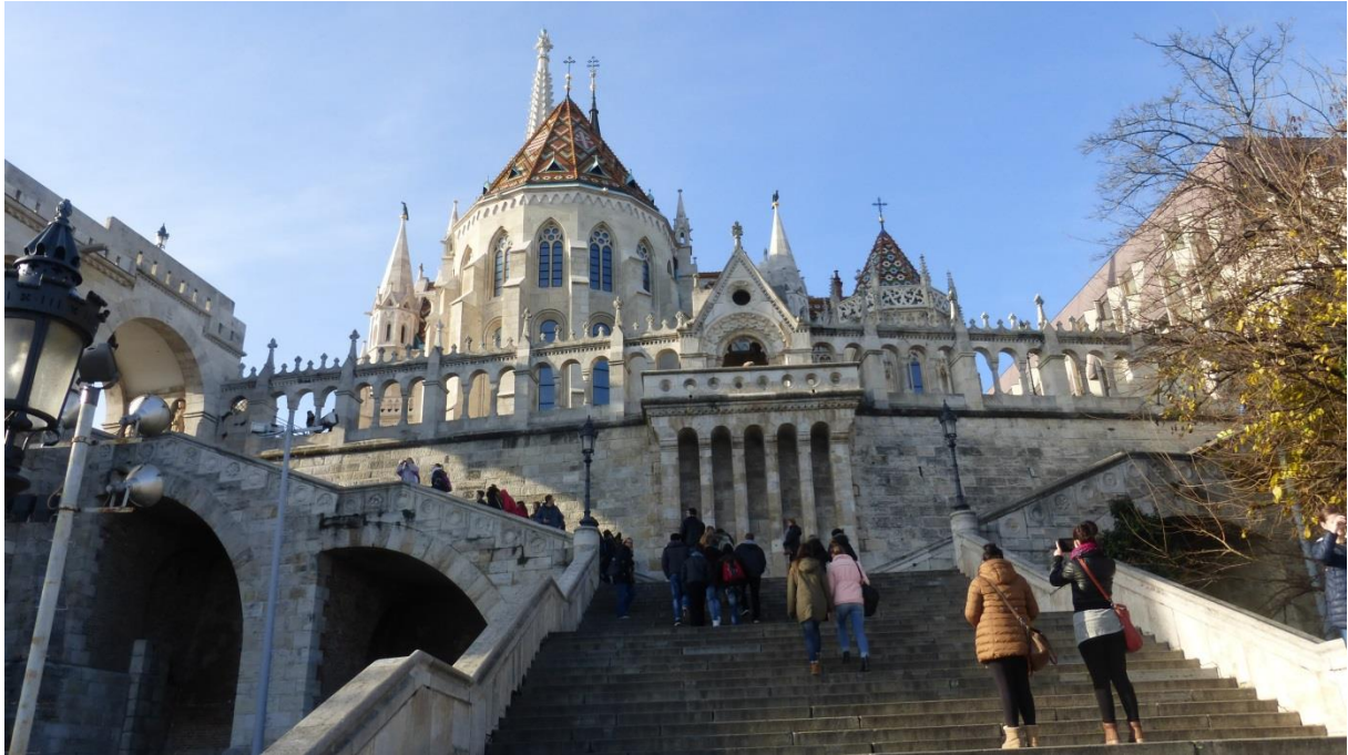
Schody na Rybársku baštu