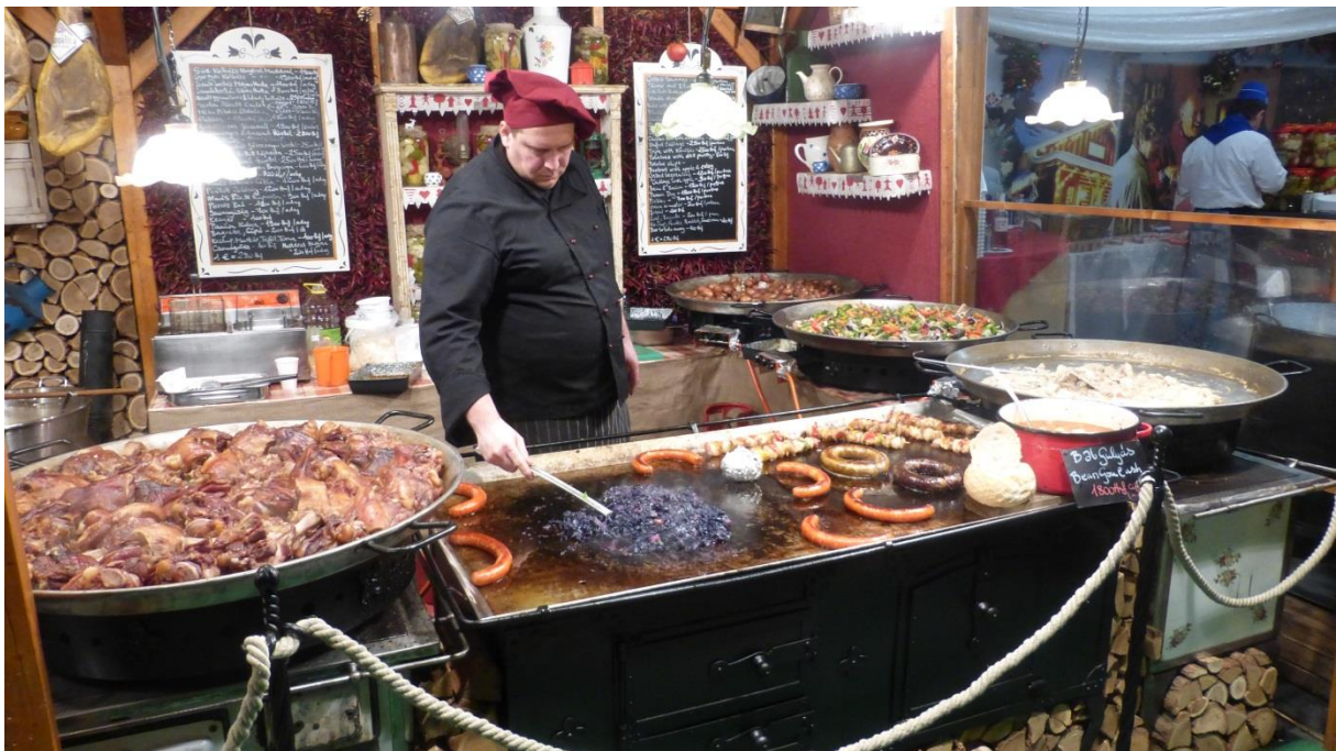
Hungarika – maďarské špeciality