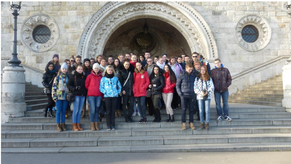
Vstup na Rybársku baštu